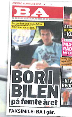
FAKSIMILE: BA i går.