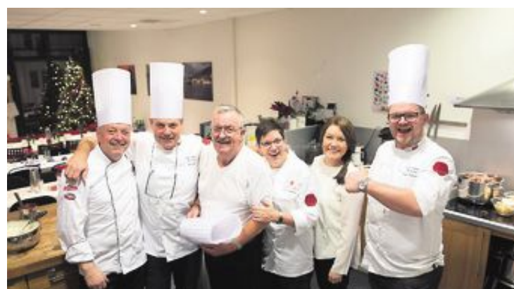
FRIVILLIGE: Kokkelaugyet stilte gladelig opp.