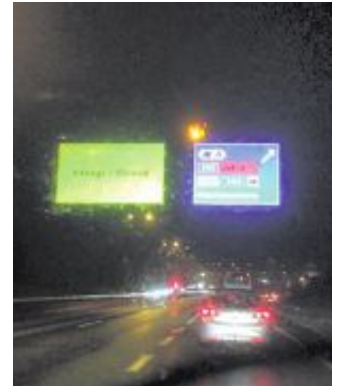
KØ: Det ble kø mot Sotra da Lyderhorntunnelen måtte stenges.

I romjulen vil de daglig arrangere ulike barneaktiviteter før de arrangerer en stor julefest neste lørdag.