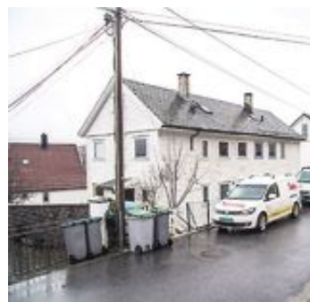
HER: Slo politiet til 11. februar.

skriver Christoffersen i en SMS: - I denne saken har vi med et barn som etter det opplyste ble giftet bort i en alder av 15 år. Barneekteskap er straffbart også i Romania. Disse barna er særs sårbare for utnyttning, og når politiet mistenker at et slikt barn har blitt utsatt for utnyttning eller er brakt til Norge for å bli utnyttet så har vi en plikt til å reagere. (...)