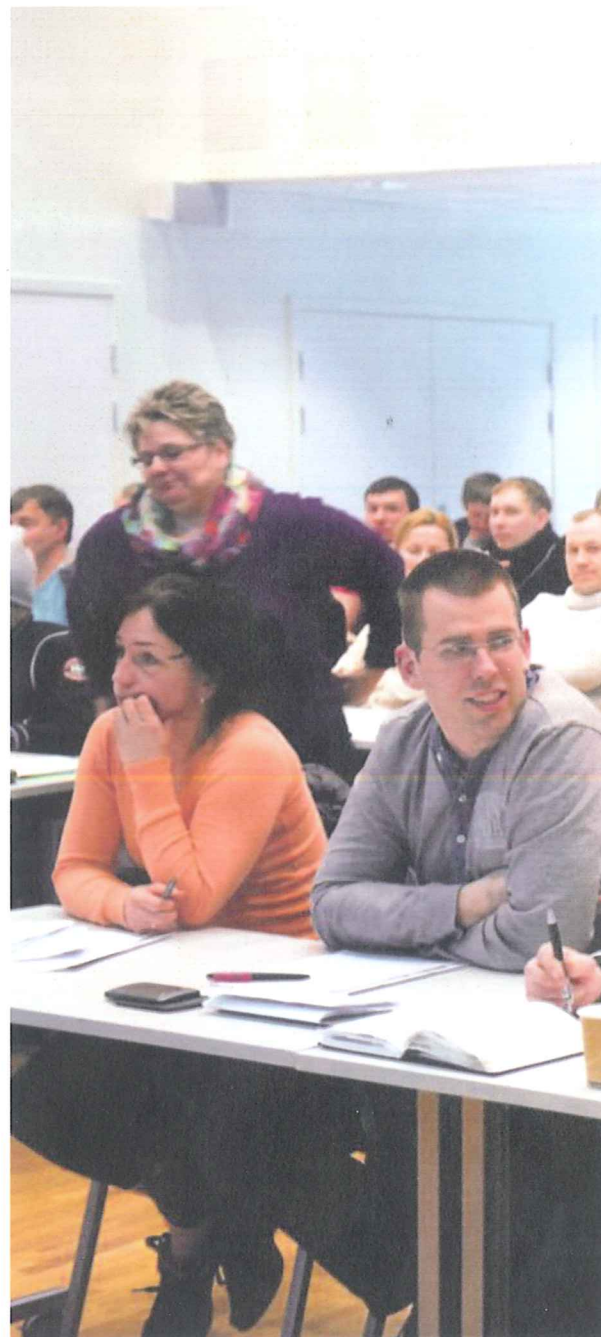
PÅ KURS: Det har vært en enorm respons på årets Skatt Vest-kurs for

- Målet er at de skal levere en korrekt utfylt selvangivelse for 2012.