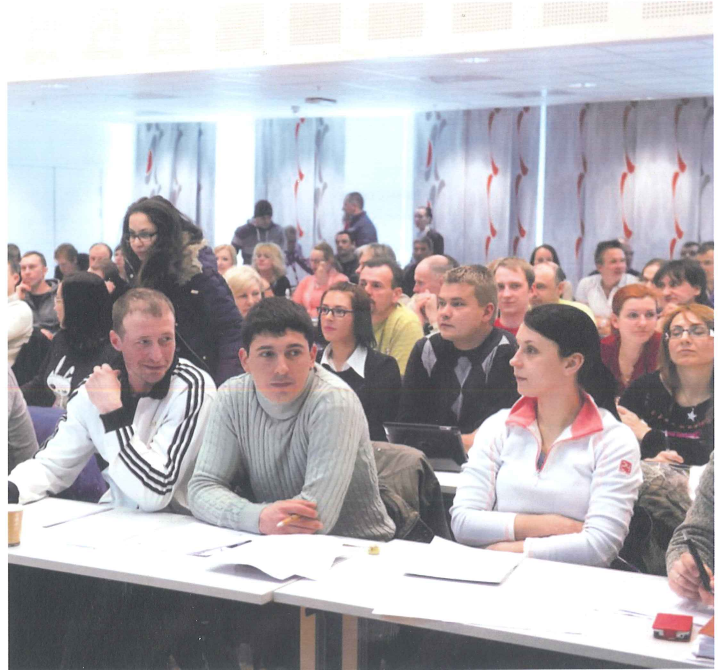
utenlandske arbeidstakere. Til sammen har over 500 personer meldt seg på de forskjellige kursene. I Bergen bidrar arbeidsinnvandrerne med 670 millioner skatte kroner.