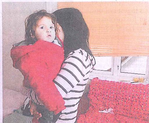
KAN HAVNE PÅ GATEN: Verken husleie eller strømregning er betalt på flere måneder.