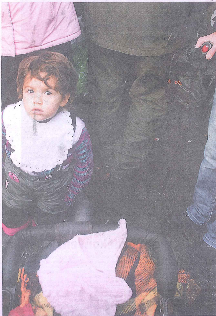
lever av den maten Kirkens Bymisjon og Robin Hood Huset klarer å skaffe dem.