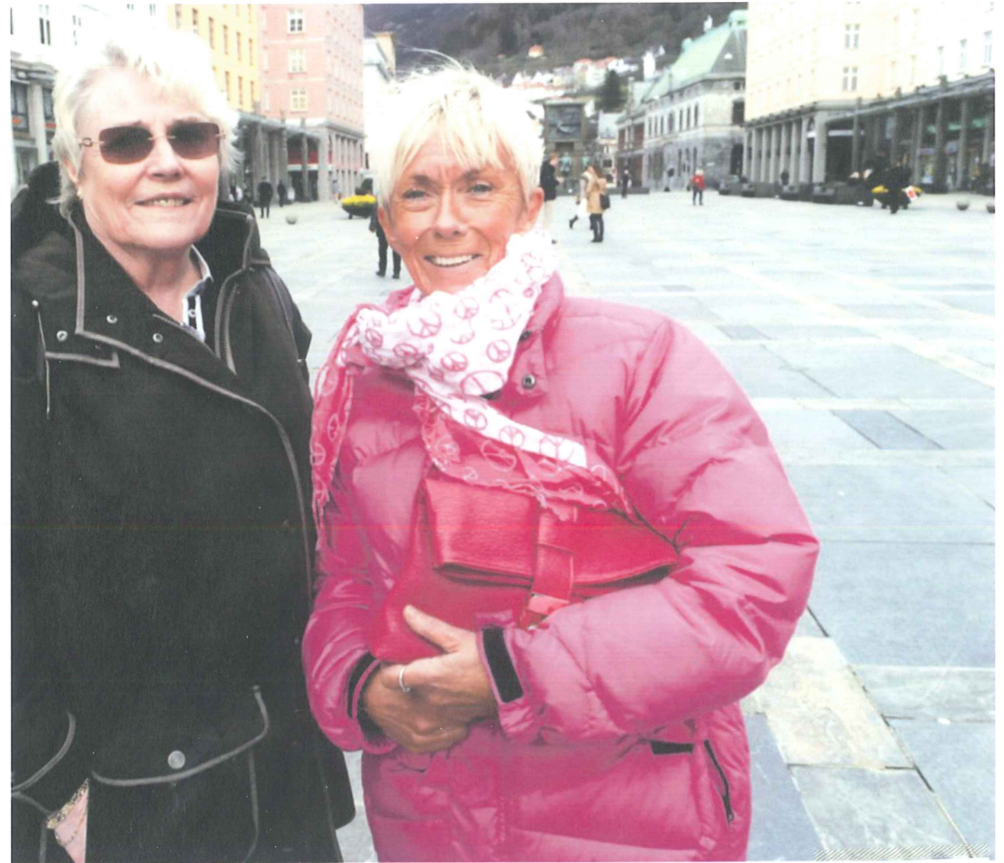
skal være i Bergen i påsken.