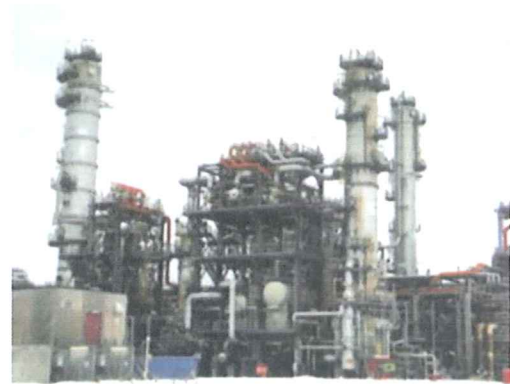
VIL BEHOLDE: Arbeiderpartiets Eirin Sund sier Stortinget står samlet bak Mongstad-prosjektet.