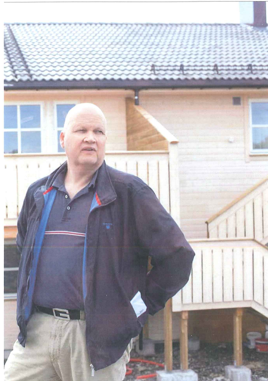
flunkende nye tre roms utleieleiligheter på rundt 70 kvadratmeter i Ulsbergglia i Åsane. Kommunen har som mål å øke boligmassen med