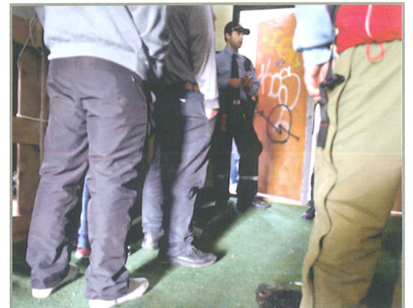
«TRØTTE»: Rumenerne i det okkuperte huset i Michael Krohns gate fortalte at de tigger, samler flasker og tar småjobber. En kvinne i huset sa dette: – Vi er trøtte. Vi sitter hele dagen i regnet. Så får vi ikke sove, politiet kommer og jager oss.