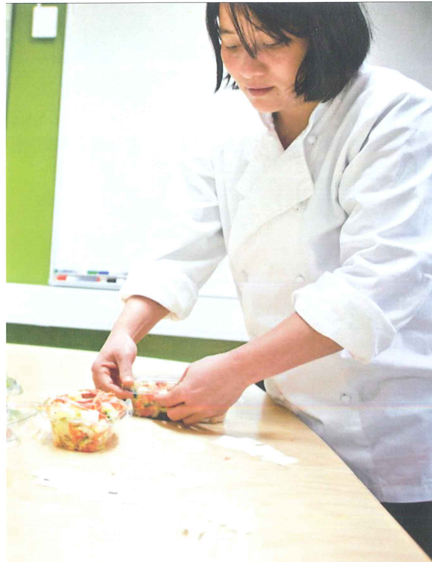
me inn på et tøft norsk arbeidsmarked.