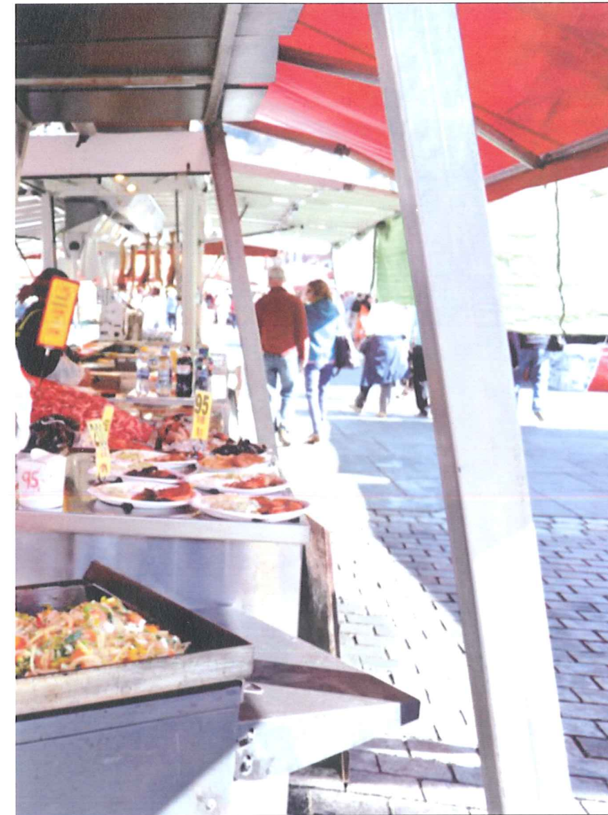
han på Fisketorget i Bergen.

Ifølge Nørstebø er 105 kroner timen lavere enn minstesatsen for ungdom under 16. For dem som har tariffavtale er time-lønnen for personer over 18 år uten ansiennitet på 145,27 kroner. Har du fylt 25 år og har tre