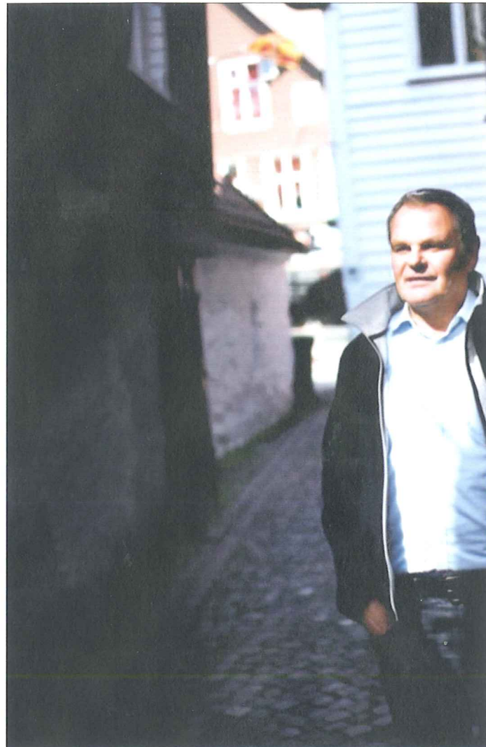
ROM I HERBERGET: – Det er mange fattige som trenger både soveplass og mat. Vi tror dette tilbudet kan hjelpe

Kirkens Bymisjon åpner sovesal for fattige EU-borgere i Bergen i oktober.