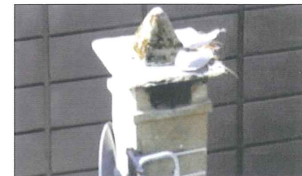
LUFTIG REIRPÅSS: Et møsepar har funnet seg et hjem oppå skorsteinen til Solheim Kjøtt i Solheimsviken. Parabol attpå har de også fått.

Send dine blinkskudd til leserbilder@bt.no eller som mobilfoto til 2211. Hver måned kårer vi en vinner som får flaxlodd i posten.