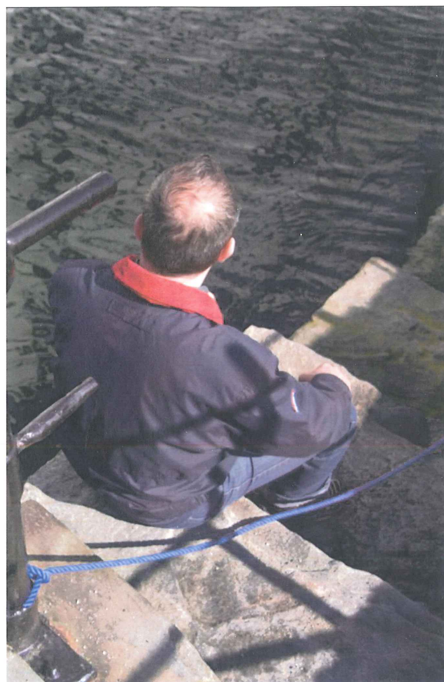
– Det er ikke et bra sted å jobbe, sier han.