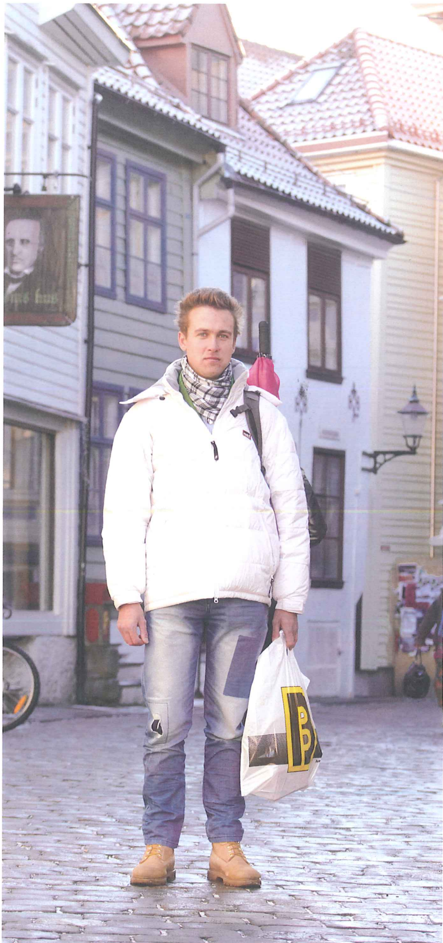
MED HÅP OM EN FREMTID: Litaueren «Pueblo» (28) har ingen jobb og egentlig ikke noe sted å bo. Mesteparten av det han eier, bærer han i en sekk på ryggen. Bæreposen er fylt med matvarer fra Kirkens Bymisjon, sponset av Kiwi.