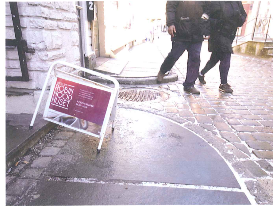
HUSLY: Skiltet utenfor Robin Hood-huset viser vei opp til et lokale hvor det serveres varm mat hver dag. Et par haster forbi.