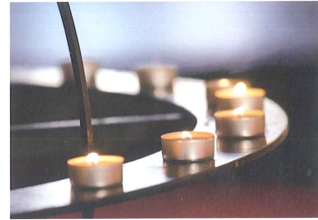
LYS I MØRKET: Flere små lys er tent i globen i Korskirken. Kirken gir søkende mulighet til å be, tenne et lys eller samtale med en diakon.

– Jeg har noe mer hos vennene mine, men det er ikke praktisk å eie så mye.