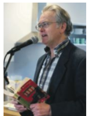
KJENDISBESØK: Gunnar Staalesen leste et utdrag fra hundre-årstrilogien.