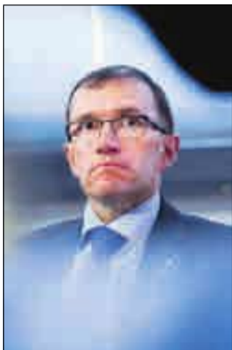
ACER-VEENN: Espen Barth Eide.

EU-kommisjonen ønsket blant annet at Acer skulle