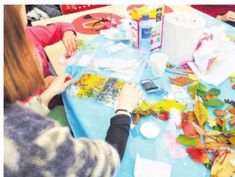
AKTIVITETER: Robin Hood-huset tilbyr aktiviteter for barn og foreldre, i tillegg til kurs og sosialt samvær.