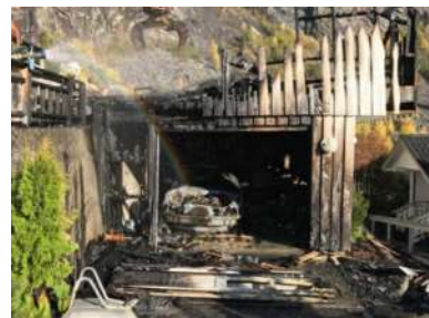
Garasjen hadde to etasjer, og inneholdt to biler og en motorsykkel.