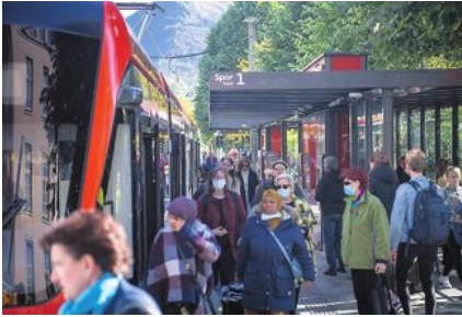
PERIODERABATT: Det blir billigere å ta buss og bane neste år, dersom du kjøper periodekort.