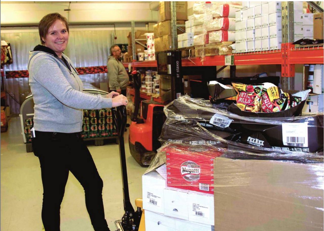
FATTIGDOM: – Det er mye skjult fattigdom. Dette er ikke noe folk snakker om. Dette er noe man vil skjule for naboen, familie og venner.