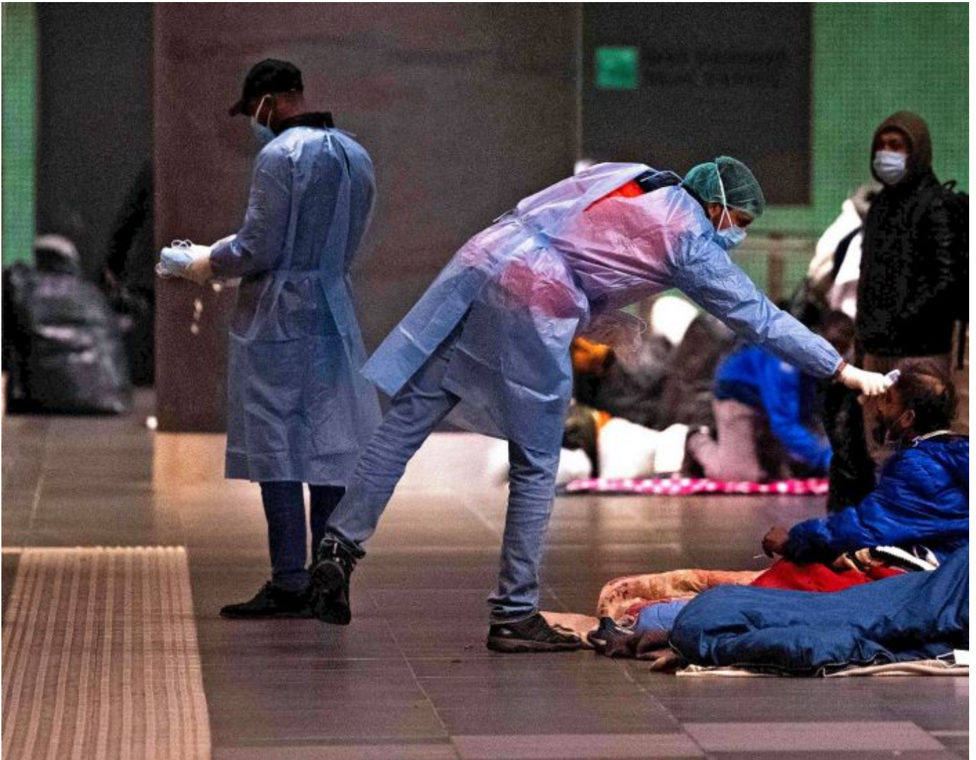
Legesjekk En lege fra organisasjonen MEDU tar temperaturen på en hjemløs mann ved Tiburtina togstasjon i Roma i Italia