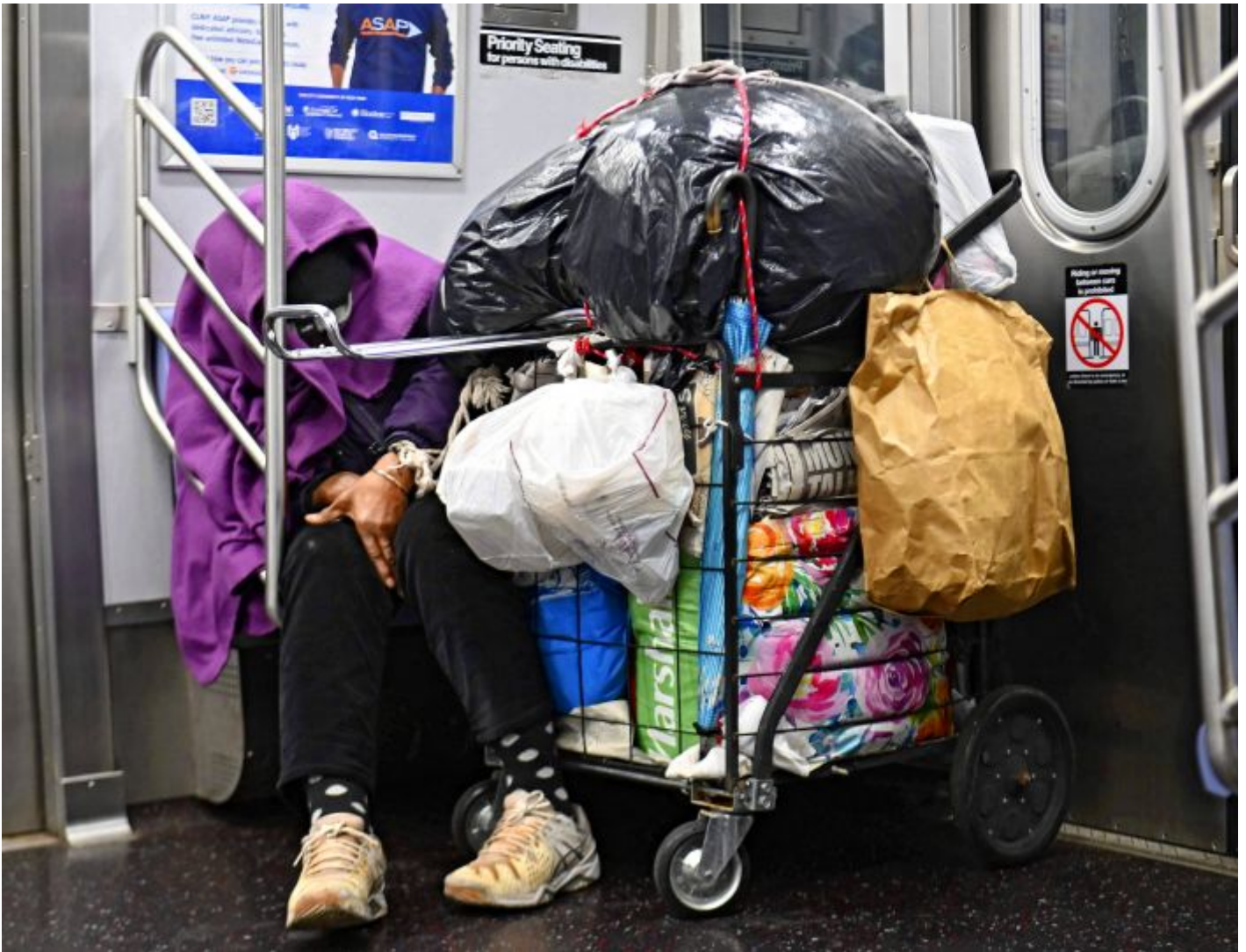
Blund på tom bane En hjemløs person sover på T-banen i New York City 29. april 2020.

– Mange lever av å samle flasker, men med færre mennesker ute blir det mindre flasker å samle. Konkurransen om flaskene er også blitt hardere. De tilreisende forteller at flere nordmenn samler nå. Mens de før kunne tjene opptil 500 kroner dagen, kan det nå ligge på mellom 30 og 150 kroner dagen, forteller Kristine Moskvil Thorsen i Kirkens Bymisjon i Bergen.