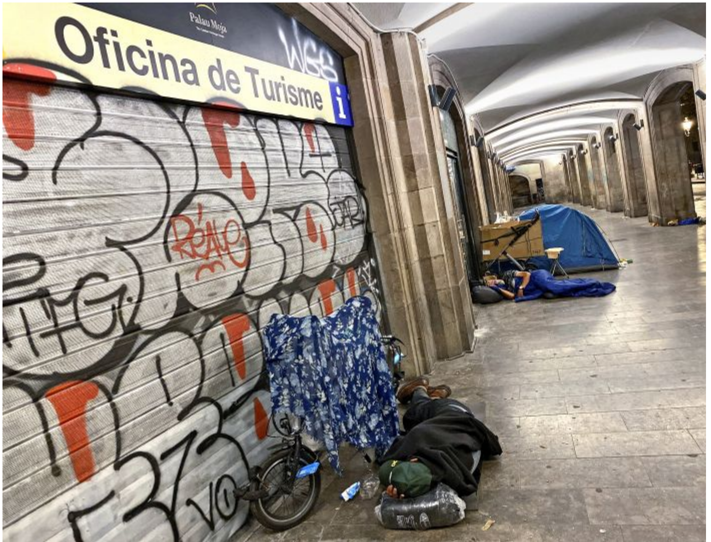
Koronastengt Hjemløse sover foran et stengt turistkontor like ved Las Ramblas i Barcelona i Spania 22. oktober 2020.