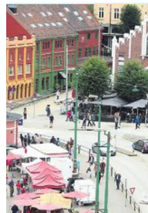
TRANGT: Har vi plass til bybane?